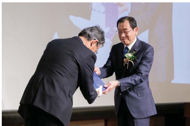
トロフィー授与の様子

当社は今回の受賞を糧に、さらに多くの皆さまにニチレキの社会課題解決に向けた姿勢をご理解いただくための情報発信を進めるとともに、安全や環境に配慮した「道」創りを推し進め、持続可能な社会の実現に貢献して参ります。